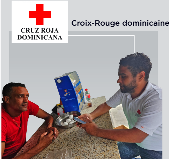
CRUZ ROJA DOMINICANA Croix-Rouge dominicaine

D Former et mettre à jour le personnel sur les travaux à distance et / ou hybride et fournir les Matériaux technologiques requis.