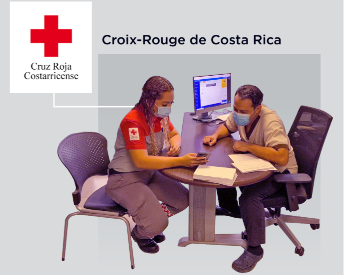
Cruz Roja Costarricense Croix-Rouge de Costa Rica